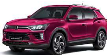
CHERRY červená (RAV)