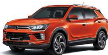
REDDISH oranžová (RAT)