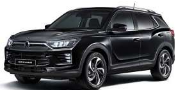
SPACE čierna (LAK)