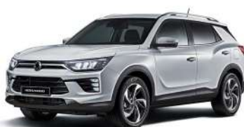
SILENT strieborná (SAI)